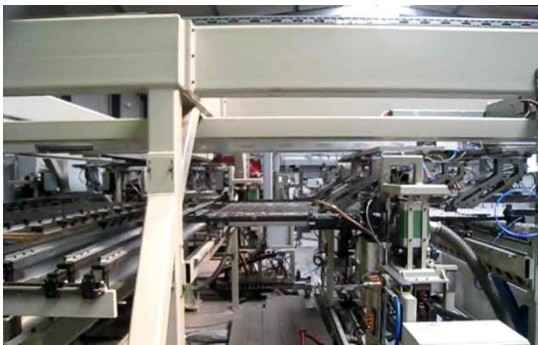
Bild: 2-bahnige Endenbearbeitung quer