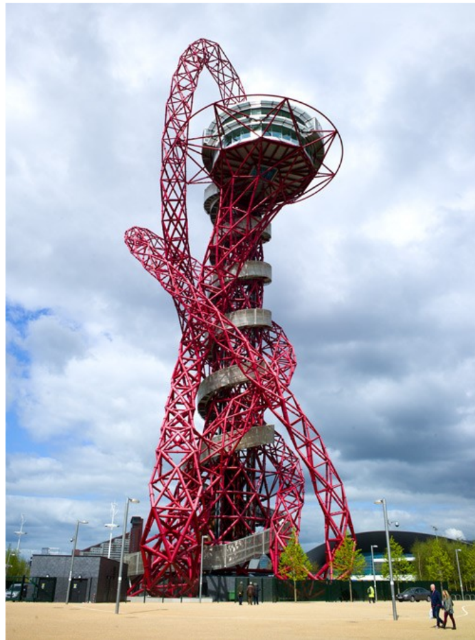
Bild: ArcelorMittal Skulptur Olympiade 2012 London